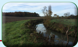
Coupe à blanc