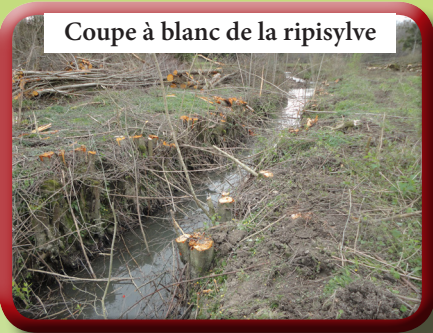
Coupe à blanc de la ripisylve