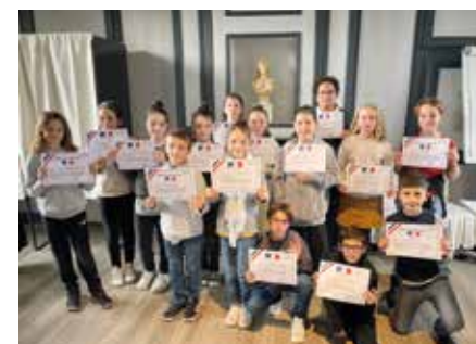
Enfants du CMJ élus pour deux ans.