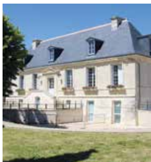
Mairie principale avec la salle du Conseil municipal qui fait office de salle de mariage