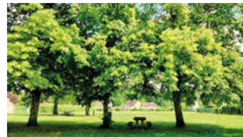
Parc Saint-Pierre et aire de jeux