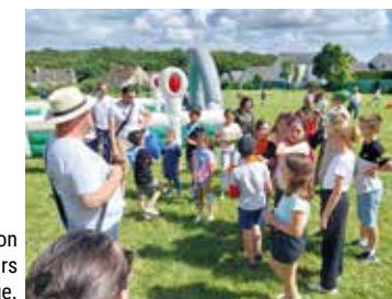
Participation aux olympiades lors de la fête du village.