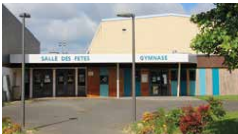
Salle des fêtes et gymnase