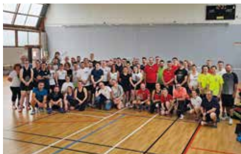
Les Dézingués du volant