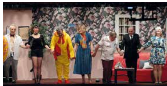
Théâtre La Compagnole