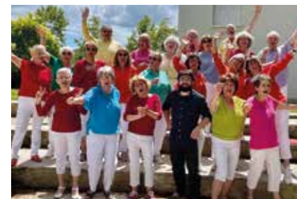
Le Chœur d'aoédé