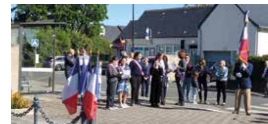
Participation aux journées commémoratives.