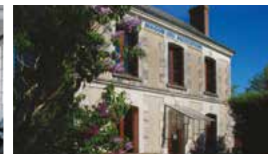
La Maison des associations