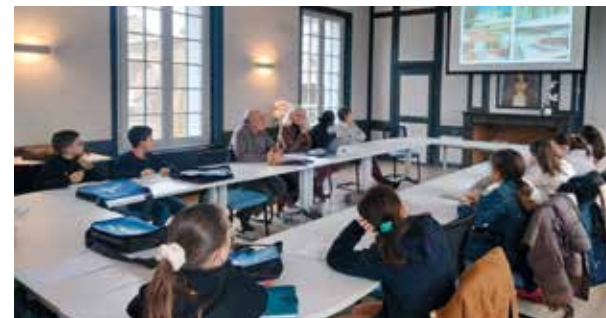
Visite de la mairie et des services.

RDV pour les élections du nouveau Conseil Municipal des Jeunes en 2025