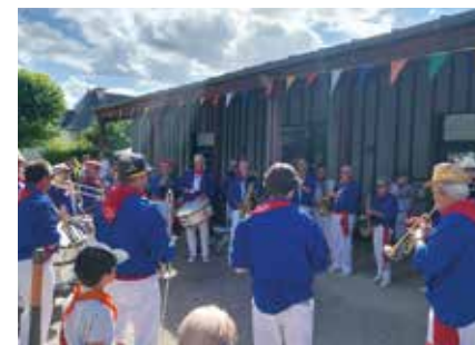
La Banda soiffée