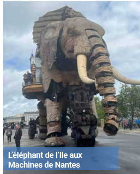
L'éléphant de l'Île aux Machines de Nantes