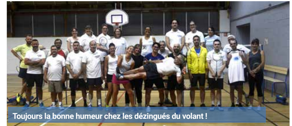
Toujours la bonne humeur chez les dézingués du volant !

En extérieur, nous participons à de nombreux tournois : Le Mans, Charentilly, Cormery, Saint Aignan sur Cher, Montoire pour