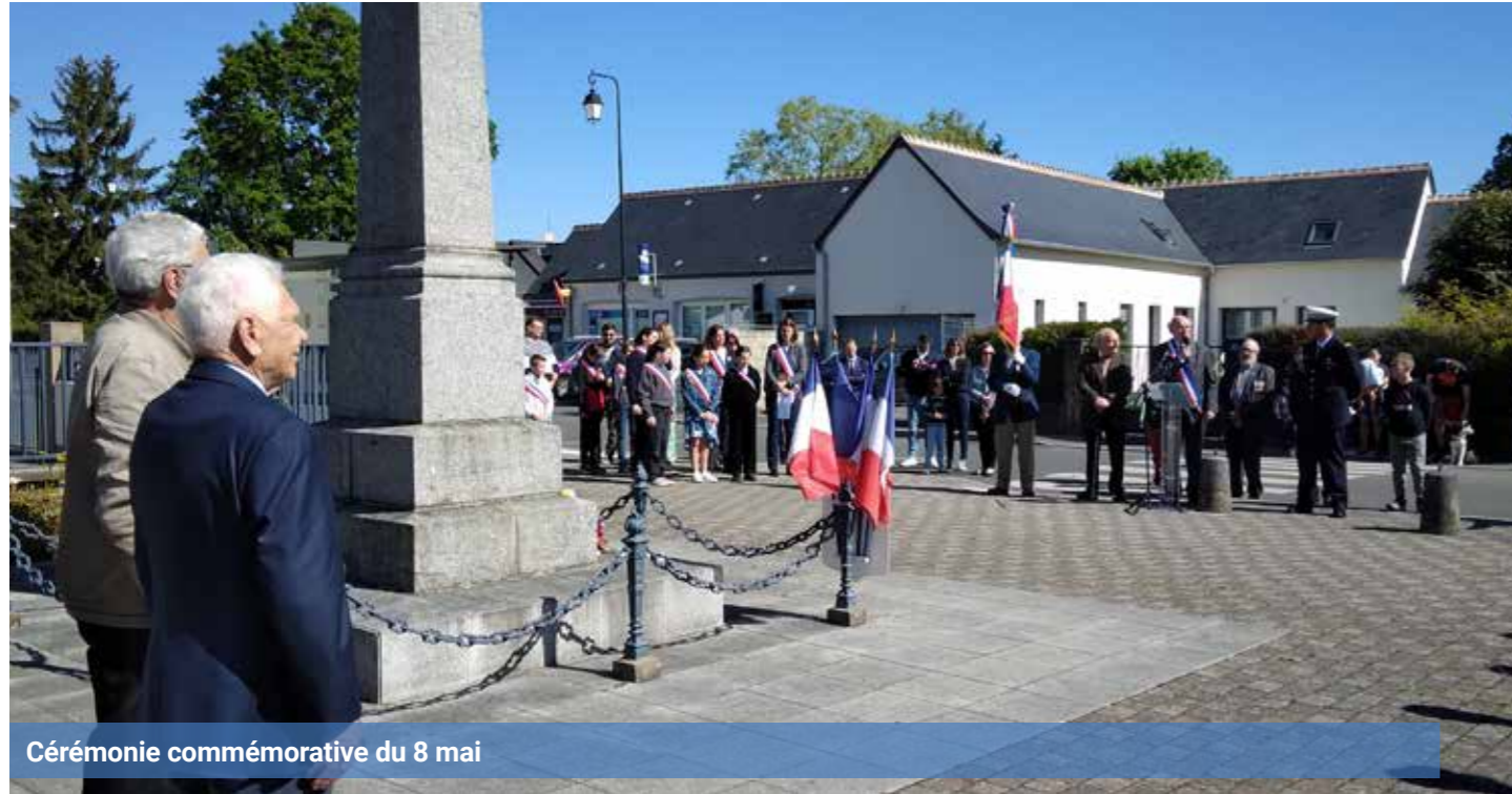
Cérémonie commémorative du 8 mai