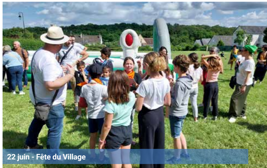
22 juin - Fête du Village