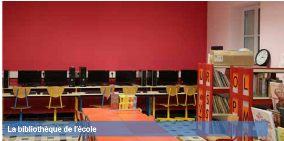
La bibliothèque de l'école

Puis, pendant les vacances de la Toussaint, des travaux de revêtement de sol ont eu lieu dans une des classes de CP. Ces travaux de rénovation réguliers permettent de maintenir les bâtiments du groupe scolaire en bon état et un environnement agréable pour les enfants et les enseignants. ▲