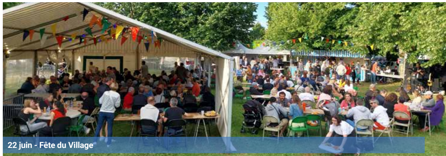
22 juin - Fête du Village