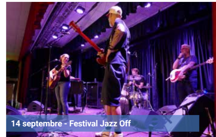
14 septembre - Festival Jazz Off