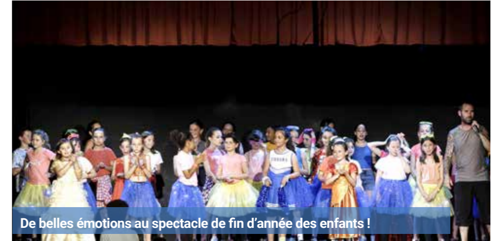
De belles émotions au spectacle de fin d'année des enfants !

Danseuses et danseurs se joignent solidai-