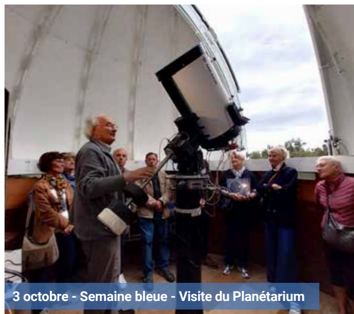
3 octobre - Semaine bleue - Visite du Planétarium