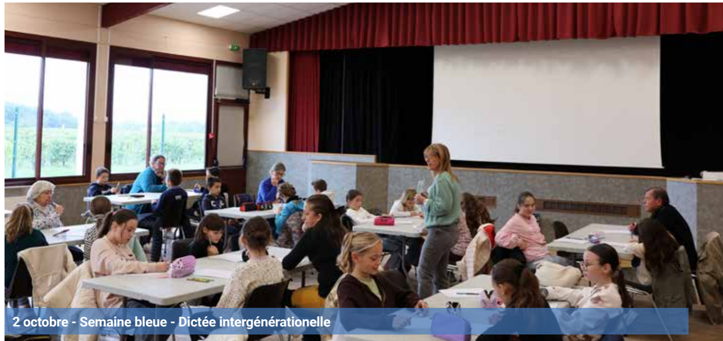
2 octobre - Semaine bleue - Dictée intergénérationnelle