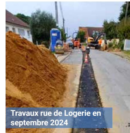
Travaux rue de Logerie en septembre 2024

permettent non seulement d'améliorer la sécurité nocturne, mais aussi de réduire la consommation énergétique, s'inscrivant ainsi dans une démarche économique et écologique.