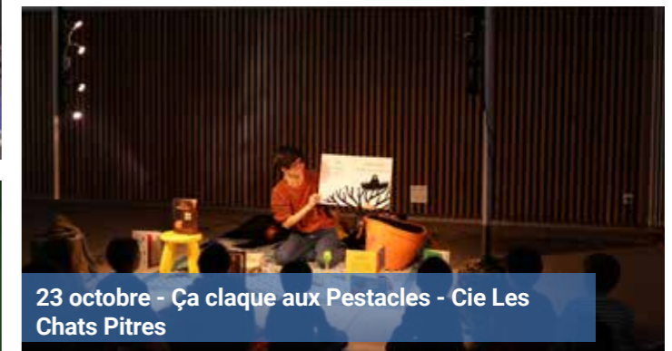
23 octobre - Ça claque aux Pestacles - Cie Les Chats Pitres