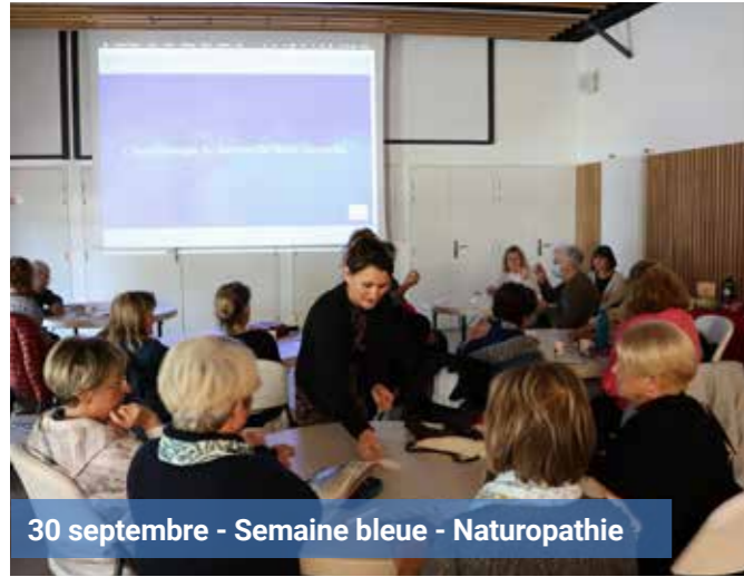
30 septembre - Semaine bleue - Naturopathie