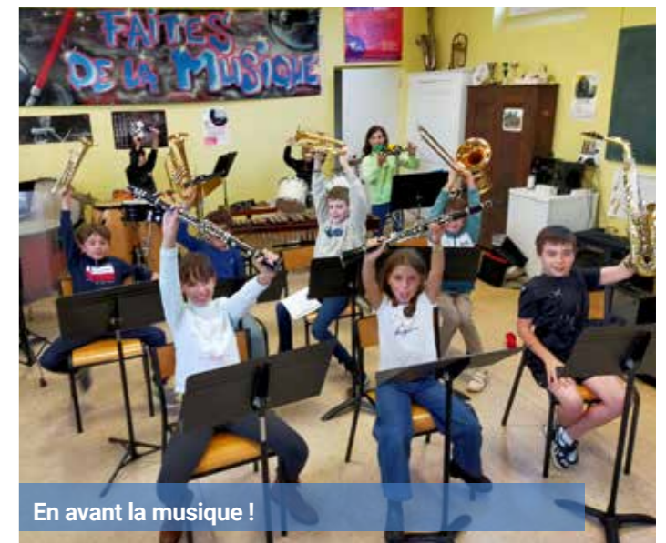
En avant la musique !