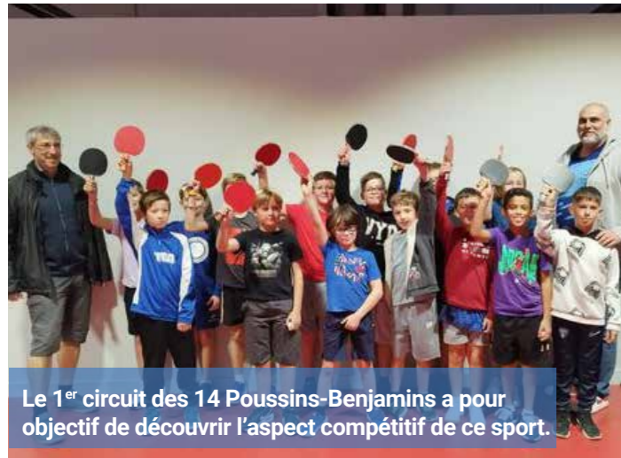
Le 1 er circuit des 14 Poussins-Benjamins a pour objectif de découvrir l'aspect compétitif de ce sport.

Le tennis de table de Parçay-Meslay se porte bien, avec 114 inscrits, un record ! On devrait finir à 130 licenciés avec les licences en cours et des refus par la suite. Nous avons deux équipes seniors supplémentaires, soit un total de 10 équipes, un record également. Les féminines reviennent au club, huit pour le moment. Mais des licences sont en cours. Nous devrions