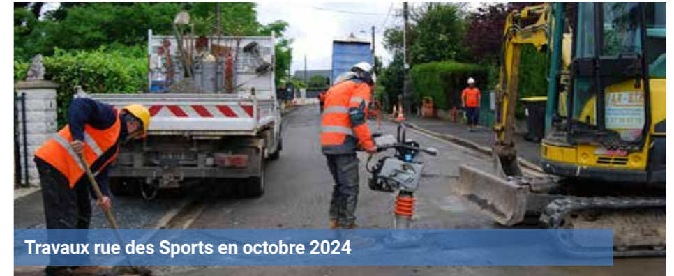
Travaux rue des Sports en octobre 2024

Puis, une reprise complète de la chaussée en enrobé a été réalisée. Le coût de cette opération est partagé entre le SIEIL, la Métropole et la commune. Enfin, il est à noter que les trois rues ont pris un nouveau visage grâce à l'installation de candélabres LED pour l'éclairage public. Ces nouvelles installations, entièrement financées par la commune,