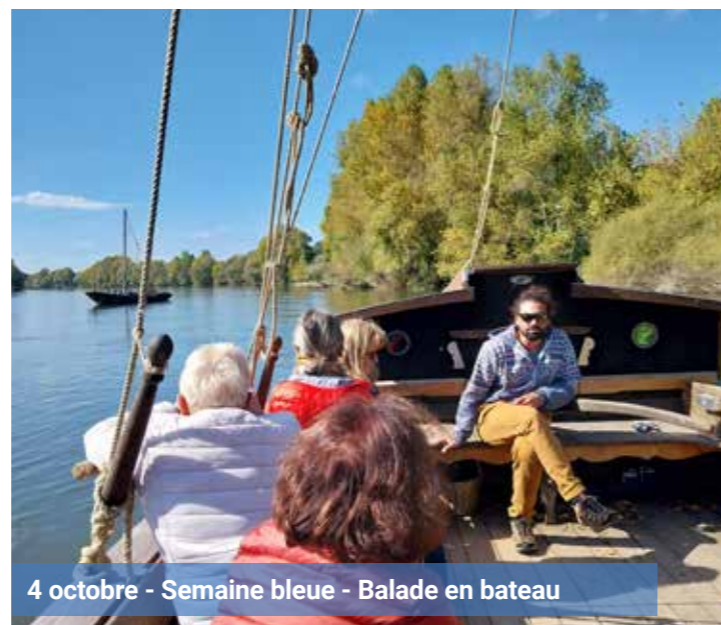
4 octobre - Semaine bleue - Balade en bateau