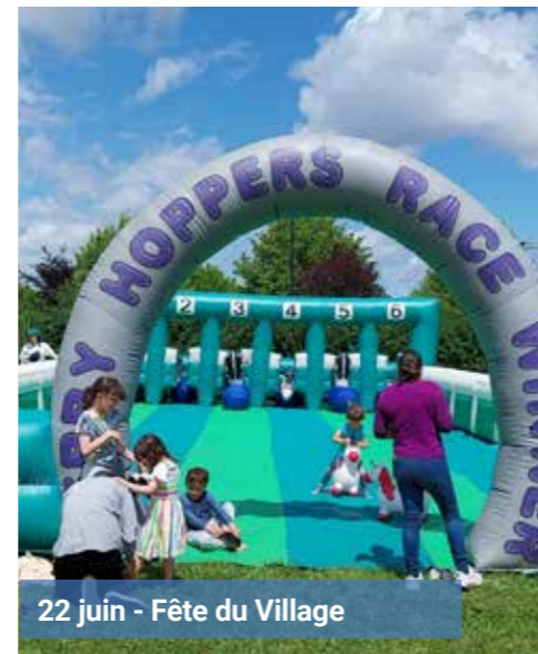
22 juin - Fête du Village