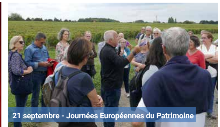
21 septembre - Journées Européennes du Patrimoine