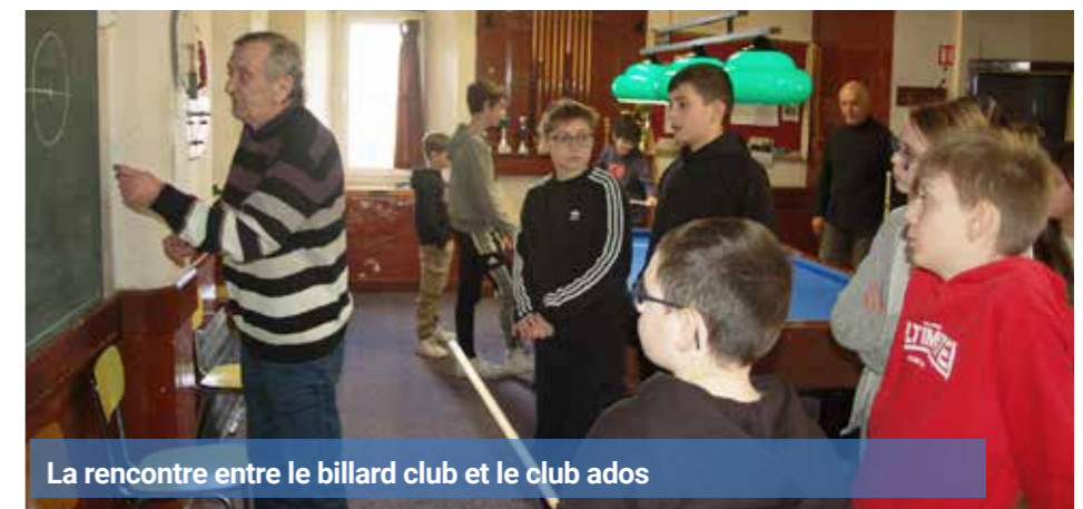
La rencontre entre le billard club et le club ados

Nous sommes aussi fiers de compter parmi nous un champion de France de billard carambole, dont la présence est un véritable atout pour ceux qui souhaitent se perfectionner. Ses conseils avisés permettent à chacun de progresser et d'af-