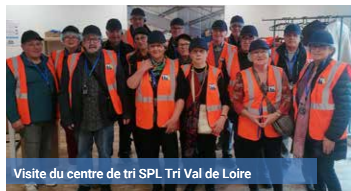
Visite du centre de tri SPL Tri Val de Loire

Après quelques années « blanches », ça y est, le concours de belote à la salle des fêtes, le dimanche 29 septembre, a été un succès, minutieusement préparé par une équipe très motivée et réussie au dire de tous.