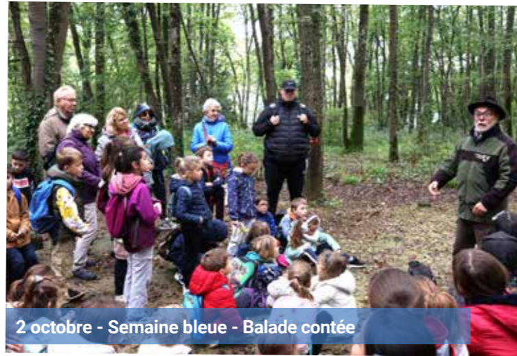
2 octobre - Semaine bleue - Balade contée