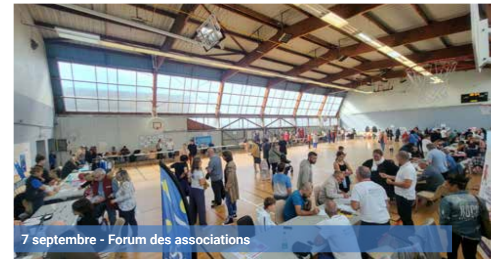
7 septembre - Forum des associations