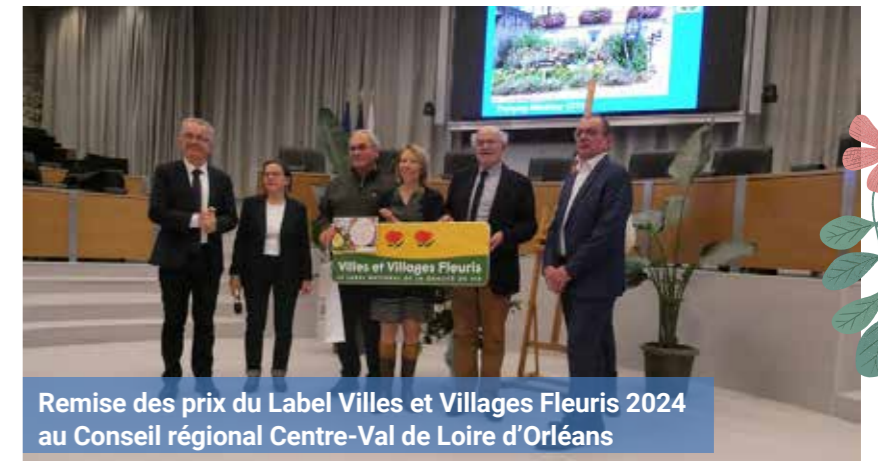
Remise des prix du Label Villes et Villages Fleuris 2024 au Conseil régional Centre-Val de Loire d'Orléans

Nous vous invitons à prendre connaissance du dossier de candidature sur le site de la ville. Cette obtention était un objectif de notre mandat et nous nous en réjouissons. ▲