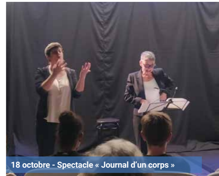
18 octobre - Spectacle « Journal d'un corps »