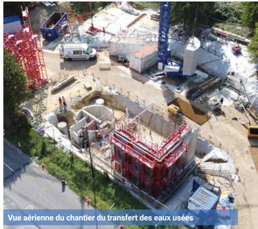
Vue aérienne du chantier du transfert des eaux usées

La mise en service de cette nouvelle station est prévue pour juillet 2025, marquant un tournant dans la gestion des eaux usées de la commune. En parallèle, l'ancienne station d'épuration sera démolie, entre avril et mai 2025, et le site dépollué. Ce projet de transfert des eaux usées représente un enjeu important, en termes d'efficacité et de maîtrise de l'impact environnemental. ▲