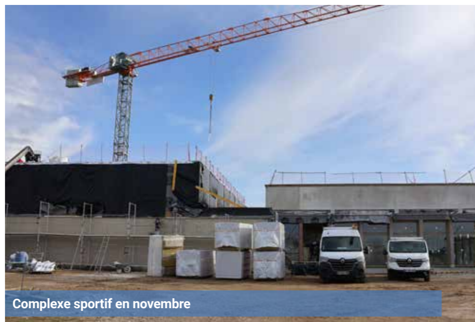
Complexe sportif en novembre

Nous devrions pouvoir bénéficier de ce bel équipement à la rentrée scolaire de septembre 2025. ▲