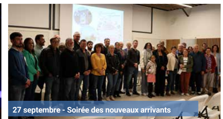
27 septembre - Soirée des nouveaux arrivants