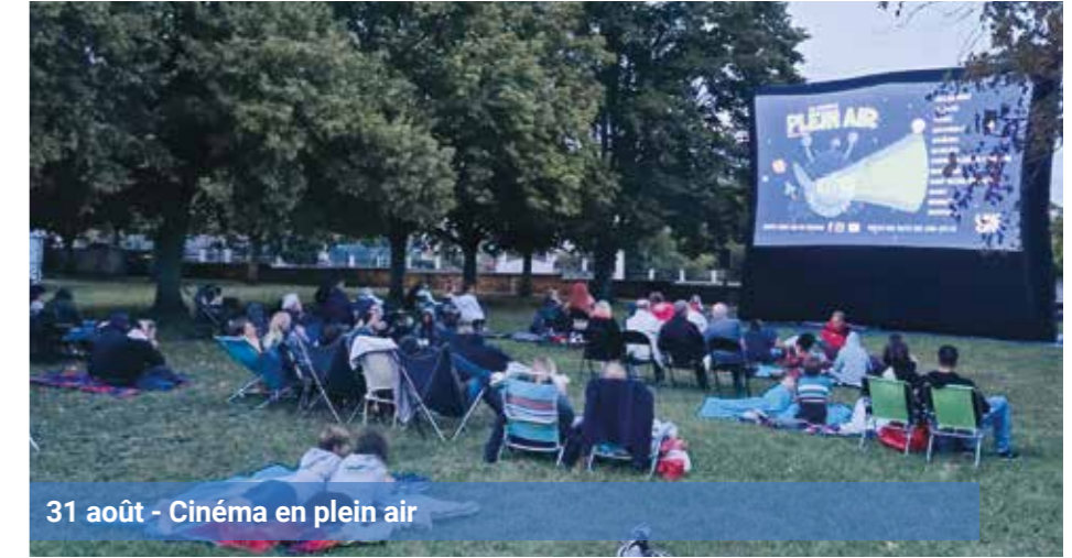
31 août - Cinéma en plein air