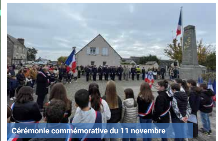
Cérémonie commémorative du 11 novembre