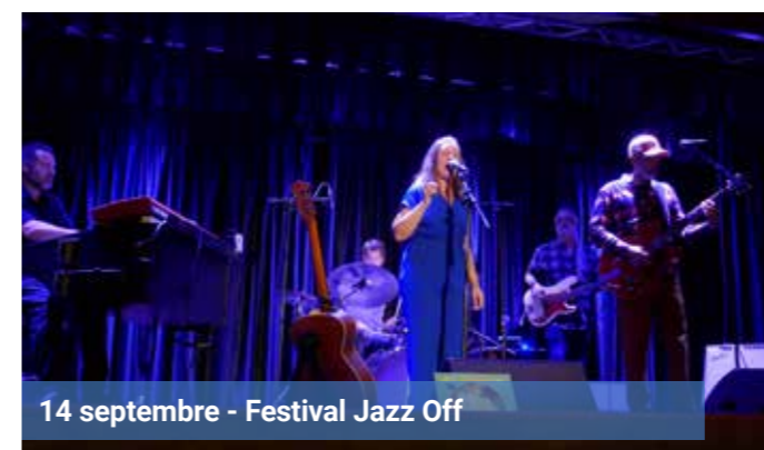
14 septembre - Festival Jazz Off