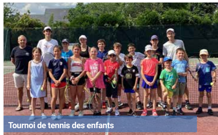
Tournoi de tennis des enfants

Le club et ses membres ont observé au printemps, avec grand plaisir, la reprise des travaux du complexe sportif, dont la livraison est prévue en 2025. ▲