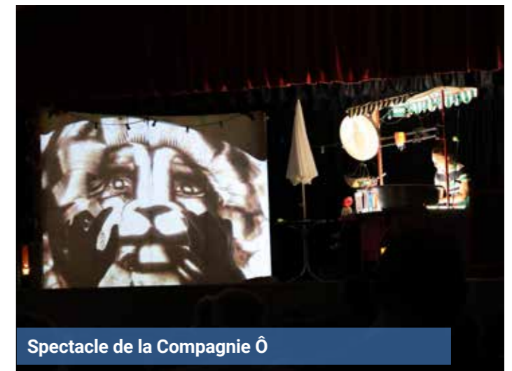
Spectacle de la Compagnie Ô

Vivement les vacances de la Toussaint de 2025, pour la prochaine édition ! ▲