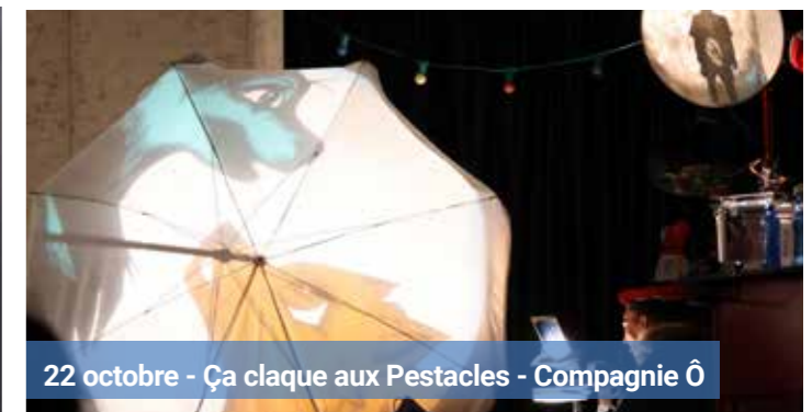
22 octobre - Ça claque aux Pestacles - Compagnie Ô