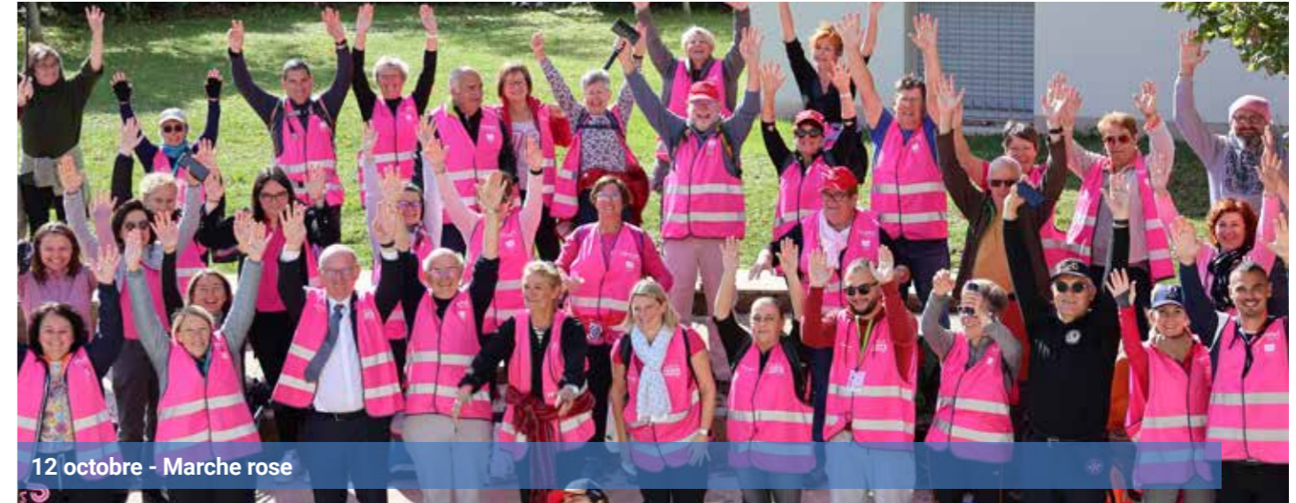
12 octobre - Marche rose