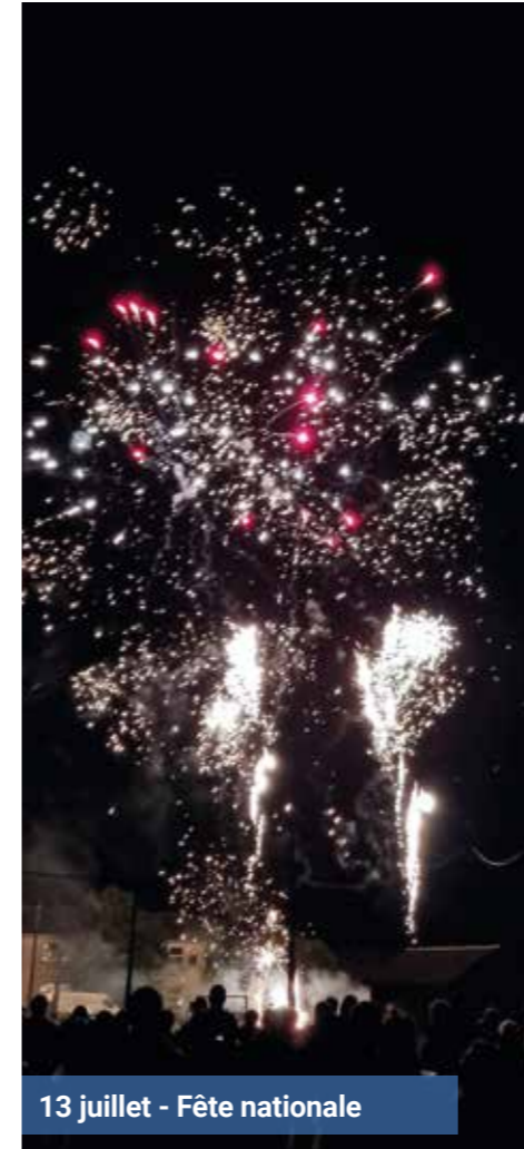
13 juillet - Fête nationale