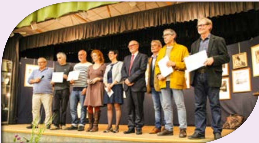
Elus et lauréats du Salon 2017

RIAGE remercie M. le Maire, ses adjoints et ses employés municipaux, pour l'installation de l'association dans les nouveaux locaux de l'orangerie