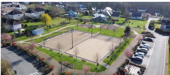
Terrains de boules et aire de jeux