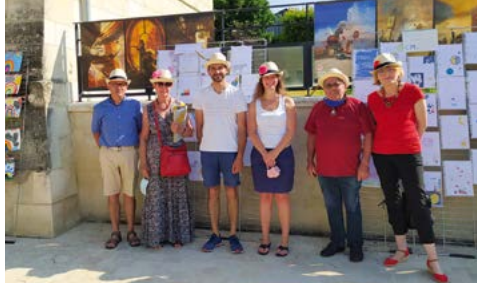
Théâtre la Compagnole