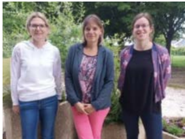
Le stretching j'adhère