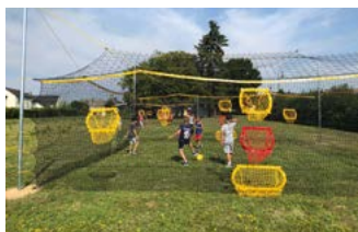
Aire de jeux