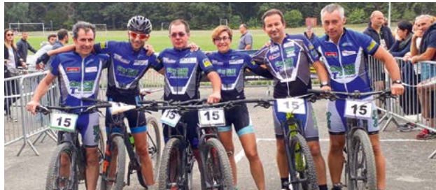
On/Off Road Touraine