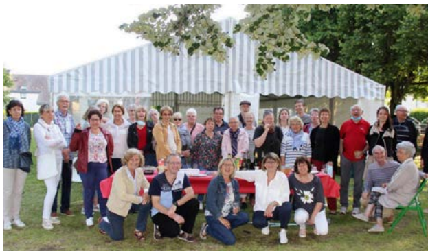
Le Chœur d'Aoédé