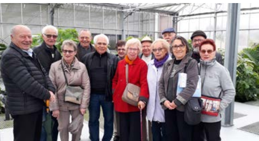
Les anciens combattants