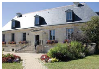
Mairie principale Grand'Maison avec sa bibliothèque