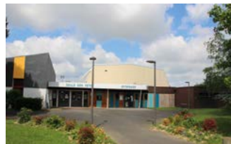
Salle des Fêtes et gymnase